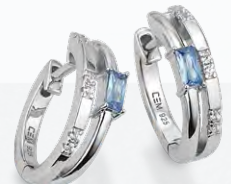
S-03575O 99,00 Creolen Zirkonia, rhd**