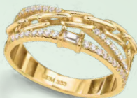
G3-02120R 529,00 Damenring Zirkonia