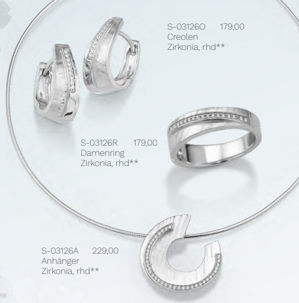
S-031260 179,00 Creolen Zirkonia, rhd**