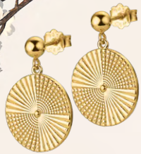
S-024100 99,00 Ohrhänger, VG*