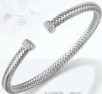
S-03567B 199,00 Armreif Zirkonia, rhd**