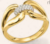
S-03413R 189,00 Damenring, Zirkonia rhd**, poliert, VG*