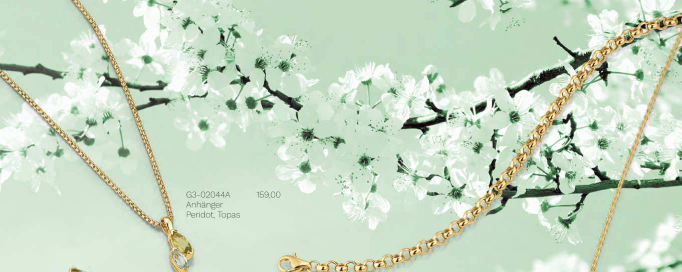
G3-02044A 159,00 Anhängen Peridot, Topas