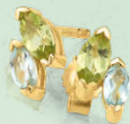
G3-02044O 259,00 Ohrstecker Peridot, Topas