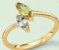
G3-02044R 379,00 Damenring Peridot, Topas