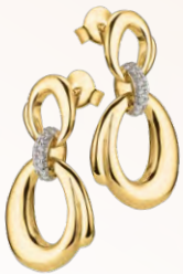
S-03413O 249,00 Ohrhänger, Zirkonia, VG*