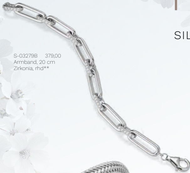
S-03279B 379,00 Armband, 20 cm Zirkonia, rhd**