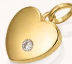
S-03404AG 79,90 Anhänger, Zirkonia, VG*