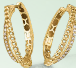
G3-02113O 429,00 Creolen Zirkonia