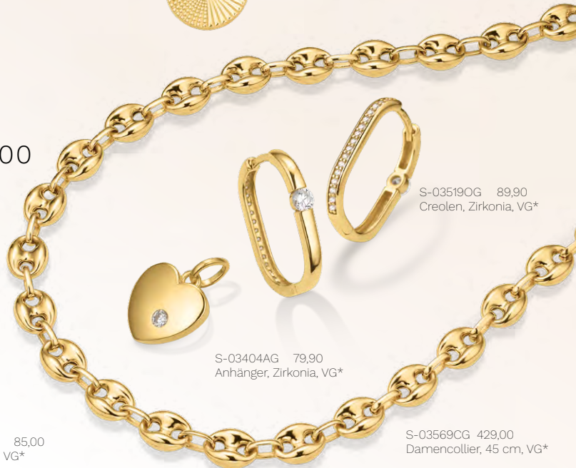
S-03569CG 429,00 Damencollier, 45 cm, VG*