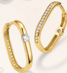
S-035190G 89,90 Creolen, Zirkonia, VG*