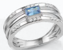
S-03575R 99,00 Damenring Zirkonia, rhd**