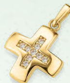
G3-02123A 209,00 Anhängen Zirkonia