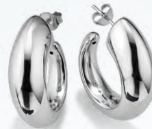
S-034150 199,00 Creolen