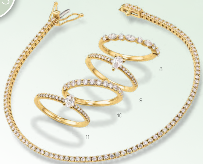
BLG3012BG 1.649,00 Armband, 18 cm 1,10 ct tw/vs