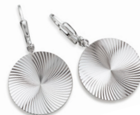
S-031740 Ohrhänger, 89,90 €

Silber rhodiniert. Zu jedem Anhänger bieten wir passende Ketten an. * Zirkonia ist ein synthetisches Produkt.