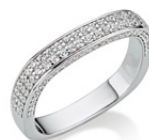
S-03350R Damenring, Zirkonia*, 99,00 €