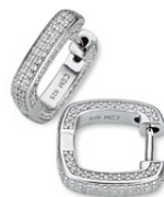
S-033500 Creolen, Zirkonia*, 119,00 €