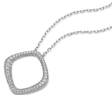
S-03350C Collier, 42 + 3 cm, Zirkonia*, 119,00 €