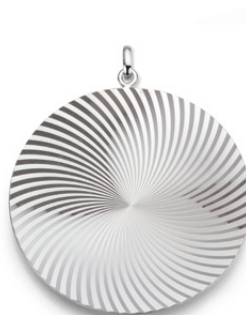
S-03174A Anhänger, 109,00 €