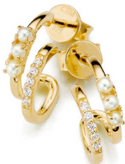
S-033530 Creolen, Zirkonia*, Süßwasser- Zuchtperle, 99,00 €